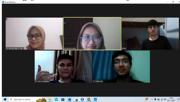
Gambar 3. Pengajaran BIPA secara daring