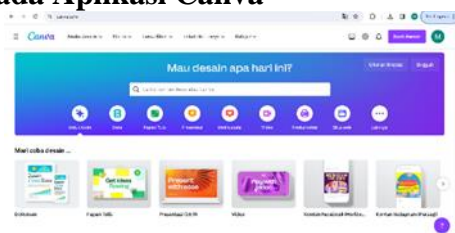
Gambar 1. Canva

Menurut Sadiman (2008: 7) menjelaskan media pembelajaran yaitu sesuatu yang bisa dipalिकासikan untuk menyampaikan pesan dari pengirim pesan kepada penerima pesan. Dalam hal ini, proses merangsang pikiran, perasaan, perhatian siswa sehingga dapat terjadi proses belajar. Sedangkan menurut Latuheru (1988: 14) media pembelajaran adalah alat atau bahan yang digunakan dalam kegiatan belajar mengajar dengan tujuan untuk menyampaikan pesan pendidikan dari sumber (guru) kepada penerima (siswa).